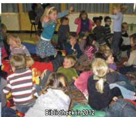
Bibliotheek in 2012