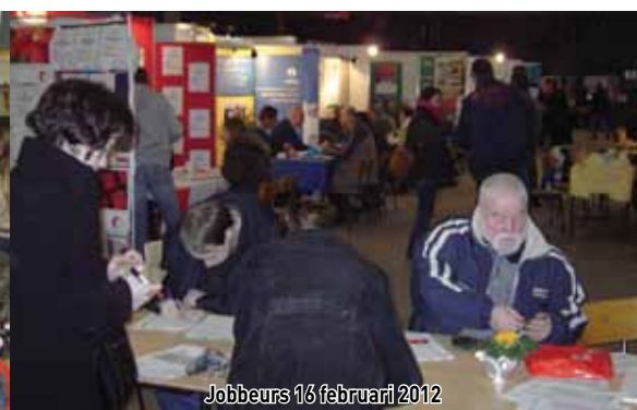
Jobbeurs 16 februari 2012