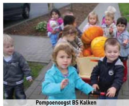
Pompoenooft BS Kalken