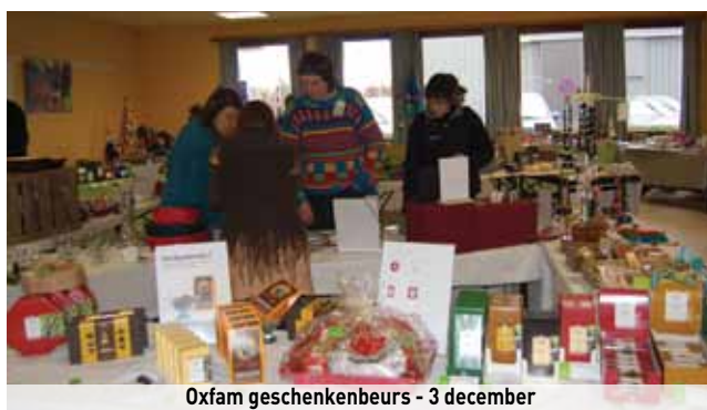
Oxfam geschenkenbeurs - 3 december