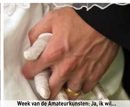
Week van de Amateurkunsten: Ja, ik wil...