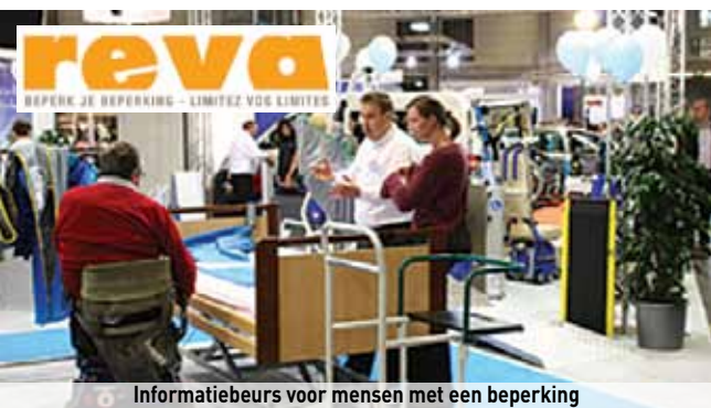
Informatiebeurs voor mensen met een beperking

Sporten voor jong en oud. Sporten in Laarne ... natuurlijk, gaarne!